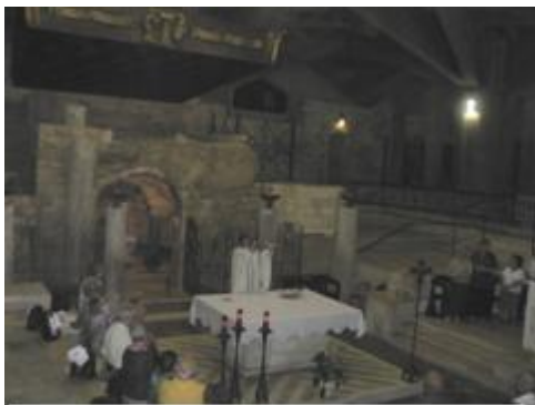
Cueva de arunciación en la Basílica del mismo nombre (Nazareth)

fuera la fuente de antaño y al parecer plaza de paso de caravanas. Ciertamente es uno de los lugares en que he indagado más posteriormente -el Google Earth es maravilloso- y más frustrado me he quedado, y con ganas de ir a quedarme unos días allí a analizar sobre el terreno toda esta información.