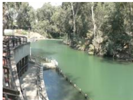
Río Jordán (lugar turístico tradicional)

En este suceso se ve con mucha más claridad el error, si es que se puede llamar así, ya que el lugar escogido es reconocido como tradicional más que como real. Esto pasa en varios casos, es decir, que ante el desconocimiento o ante la falta de información existente, se escogía un lugar para que sirviera de veneración, normalmente acompañado de una Iglesia. No es este el caso del lugar de peregrinación al río Jordán, es decir, no tiene una iglesia como tal, aunque es muy visitado por los turistas, los cuales en muchos casos se bautizan con túnica incluida (la cual alquilan lógicamente), bien por su religión o simplemente por seguir la costumbre. Se le considera un río sagrado, al cual no se puede entrar con bañador normal, en fin, cosas del comercio; algo constante esto último en todas las visitas y muy bien estudiado por el pueblo israelí o palestino.